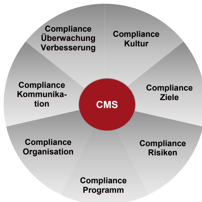
Abbildung: Grundelemente des abcfinance Compliance Management Systems

Unter Compliance wird die in der Verantwortung der Geschäftsführung liegende Sicherstellung der Einhaltung gesetzlicher und regulatorischer Bestimmungen durch das Unternehmen verstanden. Die Grundelemente des Compliance Management System (CMS) des Geschäftsbereichs abcfinance stellen sich wie folgt dar: