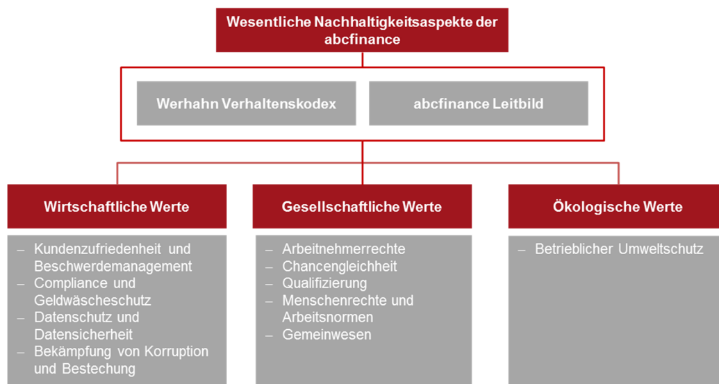
Abbildung 3: Wesentliche Nachhaltigkeitsaspekte der abcfinance

Abgeleitet aus dem Werhahn Verhaltenskodex und dem abcfinance Leitbild wurden die unter Berücksichtigung des Geschäftsmodells und Berichtspflichten nach DRS 20 wesentlichen nichtfinanziellen Werte – unterteilt in wirtschaftliche Werte, gesellschaftliche Werte und ökologische Werte – identifiziert.